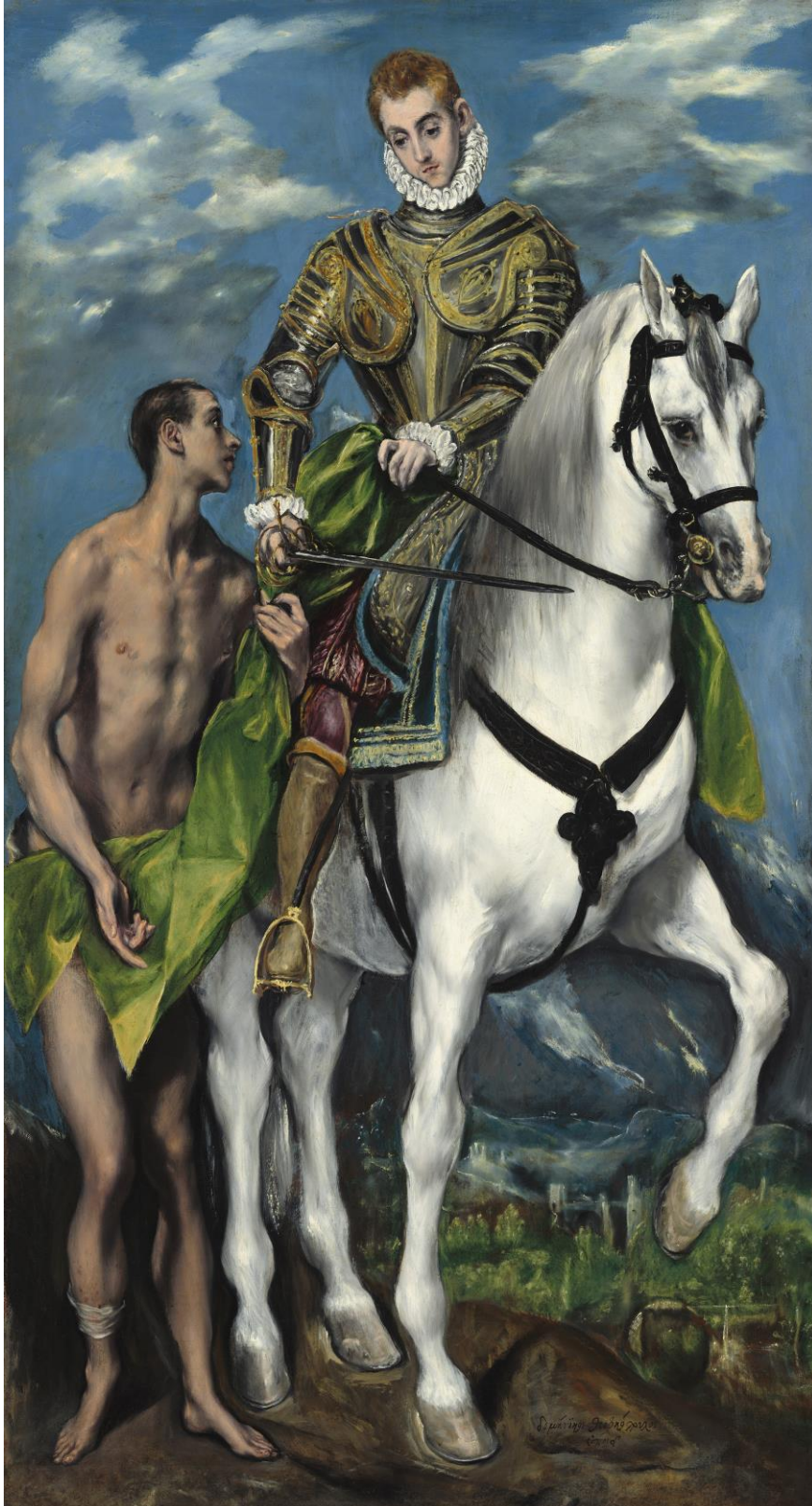
Sint Maarten (El Greco, collectie National Gallery of Art)